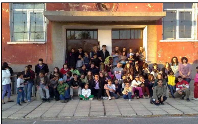
The Orphanage, Sofia