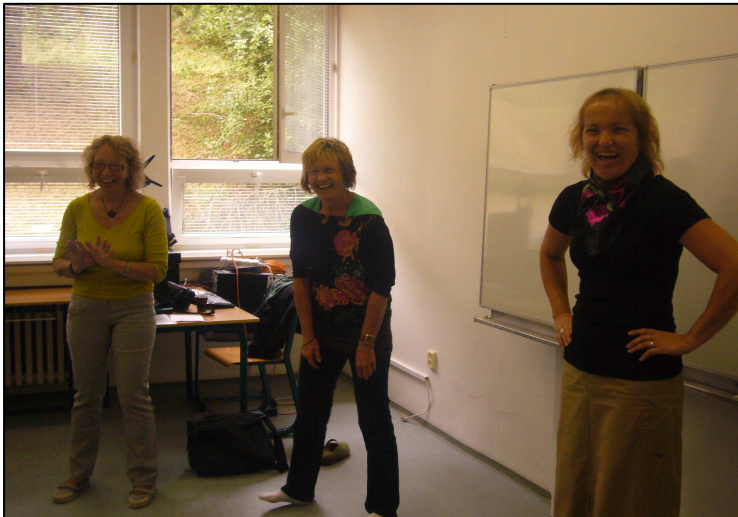
Divirtiéndose en un taller práctico